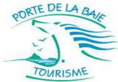
Schéma Directeur 2009 - 2010

Ce schéma directeur s'inscrit dans le contexte du «développement durable du tourisme» dont le concept, défini par l'Organisation Mondiale du Tourisme » (OMT), est rappelé en annexe.